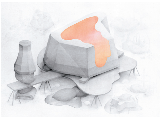
Icinori, Centrale , graphite et encre sur papier, 42 x 30 cm

Exposition du 27 avril au 10 juin 2018 Dans le cadre de Spéléographies, Biennale des écritures Vernissage le jeudi 26 avril à 18h30