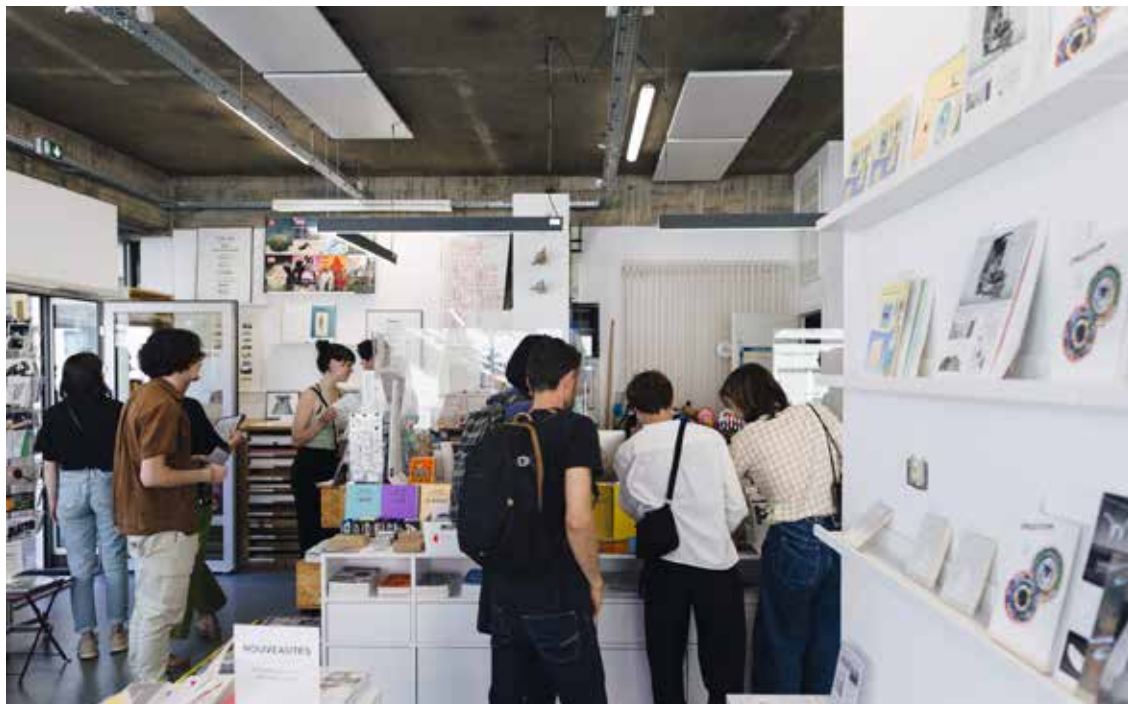
Lendroit éditions à Rennes librairie et galerie d'art imprimé

4X3 est un projet artistique porté par l'association Lendroit éditions. 4X3 propose trois panneaux grands formats installés sur le domaine public. Le public peut ainsi découvrir tout au long de l'année, 7 jours sur 7 et à ciel ouvert, le travail d'artistes contemporains. 4X3 a été inauguré en septembre 2019 sur l'avenue Aristide Briand à Rennes. La fabrication des panneaux 4x3 a été réalisée dans le cadre du budget participatif de la Ville de Rennes. Le budget de fonctionnement de 4x3 est pris en charge par l'association Lendroit éditions.