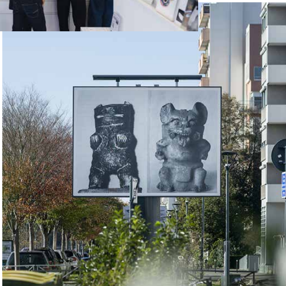
Création de l'artiste Batia Suter pour les 4x3 à Rennes